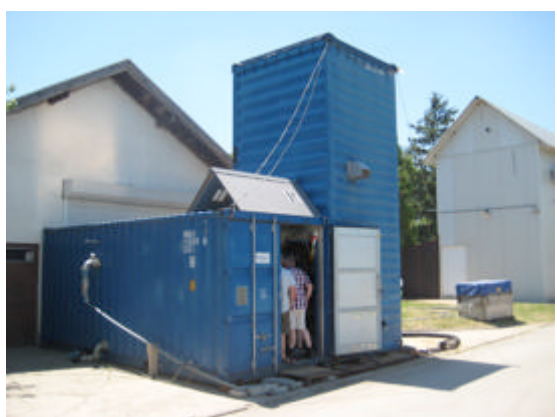
Proefopstelling in Zrenjanin