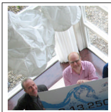
Foto: overhandiging bijdrage Sorooptimisten Hattem Epe

De andere grote gift was afkomstig van de Sorooptimisten Hattem Epe. Deze organisatie heeft in fase I van het project Senegal een groot gedeelte van de opleidingskosten voor haar rekening genomen. Ondertussen gingen de Sorooptimisten verder met het werven van fondsen voor het project Senegal. Uiteindelijk heeft dit geresulteerd in een bijdrage van 5000 euro waardoor de totale bijdrage van She op € 13.250 is gekomen. De bijdrage van € 5.000 is bestemd voor project Senegal fase II. Dames van She hartelijk dank voor jullie inzet en betrokkenheid!!!