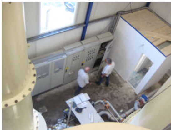
gedeelte van de opstelling