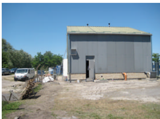
de loods waarin gewerkt werd

Over het project in Servië zijn ook goede berichten te melden. De drinkwaterinstallatie voor arseenverwijdering is opgebouwd in Backi Vionogradi, een dorpje met 1.500 bewoners in het noorden van Servië met het hoogste arseengehalte in Europa. De fundering en de opbouw van de installatie zijn gerealiseerd door het waterbedrijf van Subotica, waaronder dit dorpje ressorteert. Vrijwilligers van de stichting hebben gezorgd voor de elektrische aansluiting en het in bedrijf stellen van de installatie. De komende maanden zal de installatie moeten bewijzen dat het arseengehalte tot onder de norm wordt verwijderd. En als dit het geval is - en wie twijfelt daaraan - dan wordt de installatie eind 2012 overgedragen aan het drinkwaterbedrijf van Subotica en drinken de mensen in Backi Vinogradi voor het eerst gezond drinkwater.