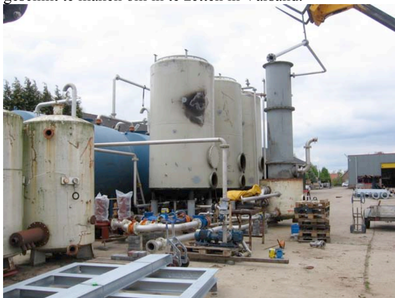
filterinstallatie in opbouw, fa. Rook

Dit werd een heel bijzondere prestatie van de vrijwilligers van de Stichting. Met man en macht is er aan gewerkt om alles te demonteren en het gebouw te vervoeren naar Varsand. De installatie zelf is naar pijpleidingbouw Rook gebracht om daar aangepast te worden en geschikt te maken om in te zetten in Varsand.