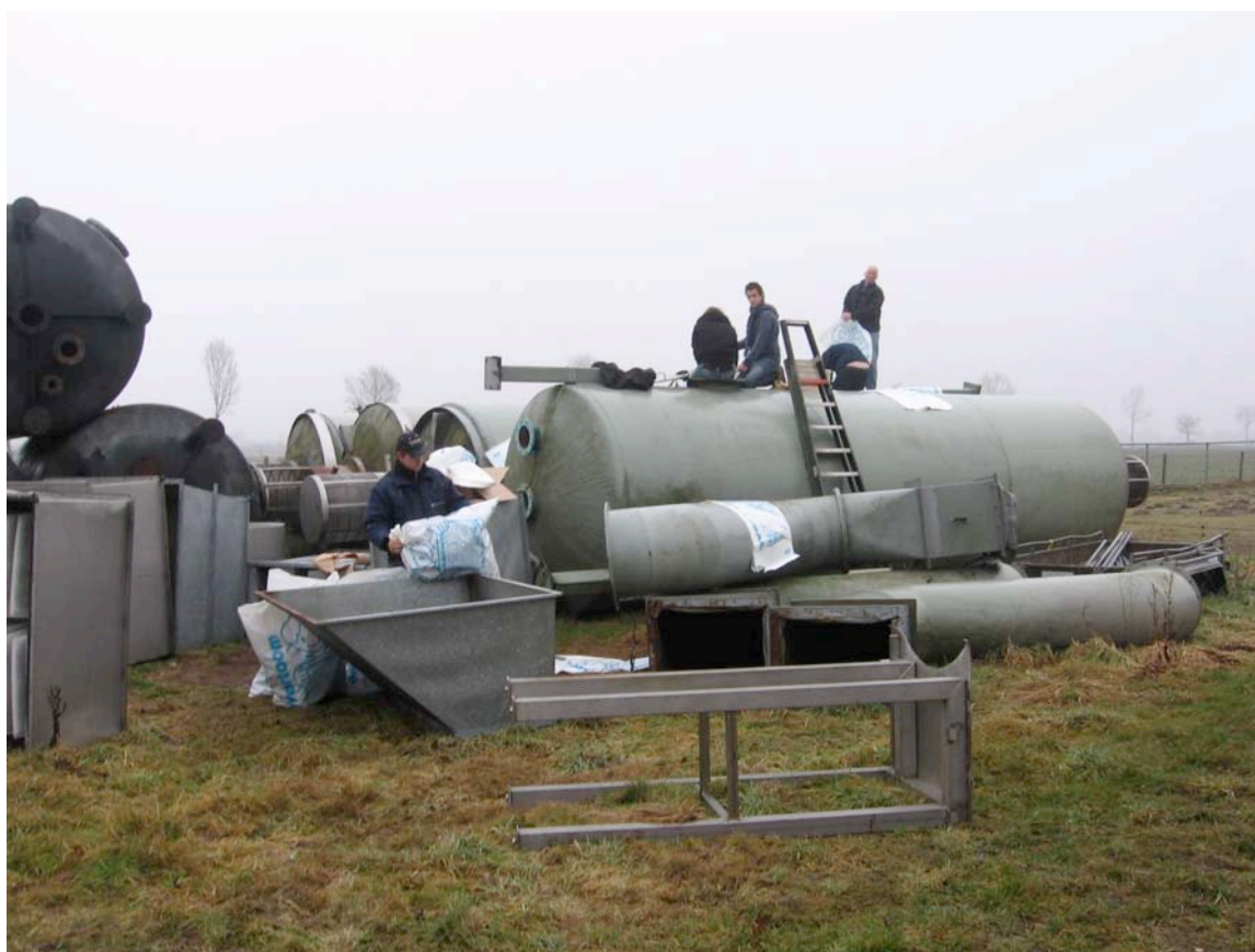
beluchtingstoren voor ombouw Livorno

Wederom heeft er een transport plaatsgevonden naar Suriname. Bij de firma Rook is een bestaande beluchtingstoren aangepast. De beluchtingstoren gaat ingezet worden op productie bedrijf Livorno. De loze ruimte in de container is opgevuld met een groot aantal bureaustoelen en 1m 3 bibliotheekboeken, geschonken door de bibliotheek Kampen. De boeken worden verdeeld over lokale scholen in Lelydorp. De container is inmiddels in Paramaribo aangekomen.